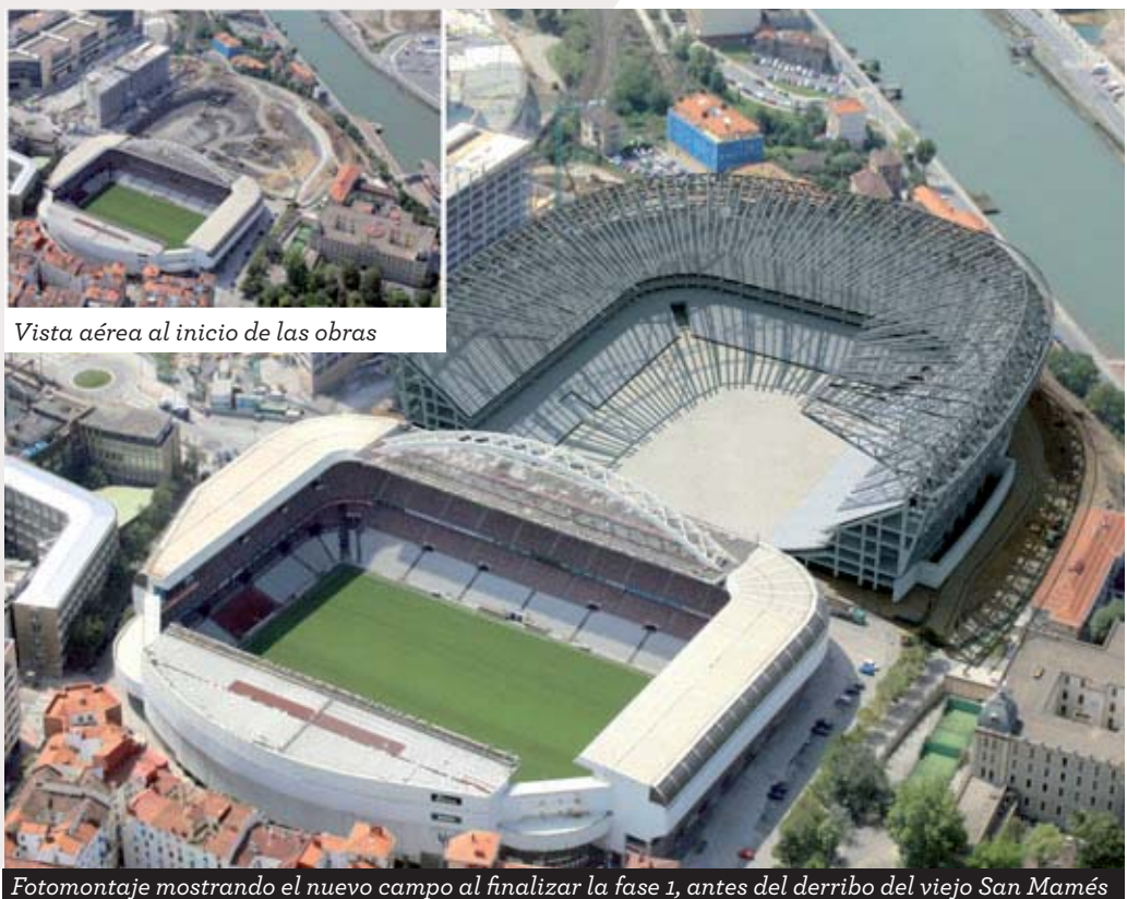
Vista aérea al inicio de las obras

Por otro lado, Corres recordó el compromiso adquirido por la sociedad propietaria del futuro campo, compuesta por el Athletic